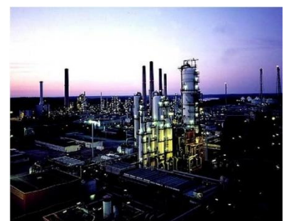
ig.3 Refinería de Porvoo, Finlandia