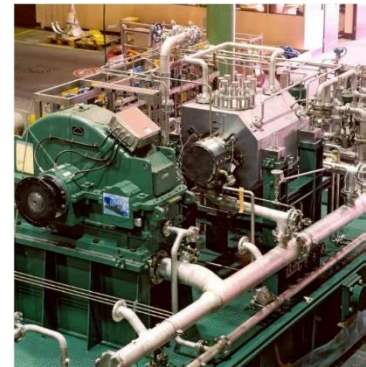
Fig. 1: Turbocompresor de gas de hidrógeno de MAN Turbo

Sistema: BOLLFILTER Duplex Tipo BFD-C BOLLFILTER Duplex Tipo BFD-P